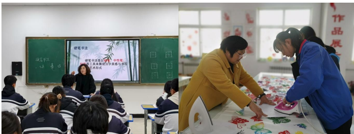
图 4-4 传统文化技艺授课