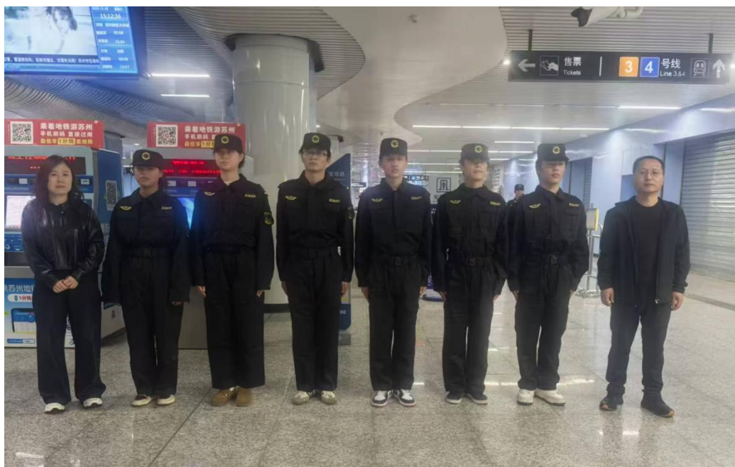
图 5-1 航空服务专业学生赴江苏动铁航海教育科技有限公司实习

的办学模式，依托专业优势建成了汽车修理厂、驾驶员培训学校、小型汽车驾驶人社会化考场等对口服务专业教学的校办企业实体。二是实行引企入校，在多方考察论证的基础上，学校和中电协（北京）电子商务技术研究院、陕西航宇科技有限公司签署了校企合作协议，企业来校建成电子商务、航空服务专业实训室，进一步增强了学校的办学实力，吸引了更多的初中毕业生来学校就读；三是通过东西部联合办学、苏陕合作、“双百工程”对口帮扶、中高职联合办学等形式，和镇江高等职业技术学校、渭南职业技术学院、渭南师范学校签订了合作协议，开展专业共建、学生共育，共建优质生源地和大学生实习基地。每年派相关领导、骨干教师赴江苏进行培训学习，吸收东部地区先进的理念和教育教学方法，提高自身专业知识和技能水平，以少数带动多数，先进带动全体的思路，促进教师队伍整体水平提高，实现“优势互补、合作双赢”的办学目标。