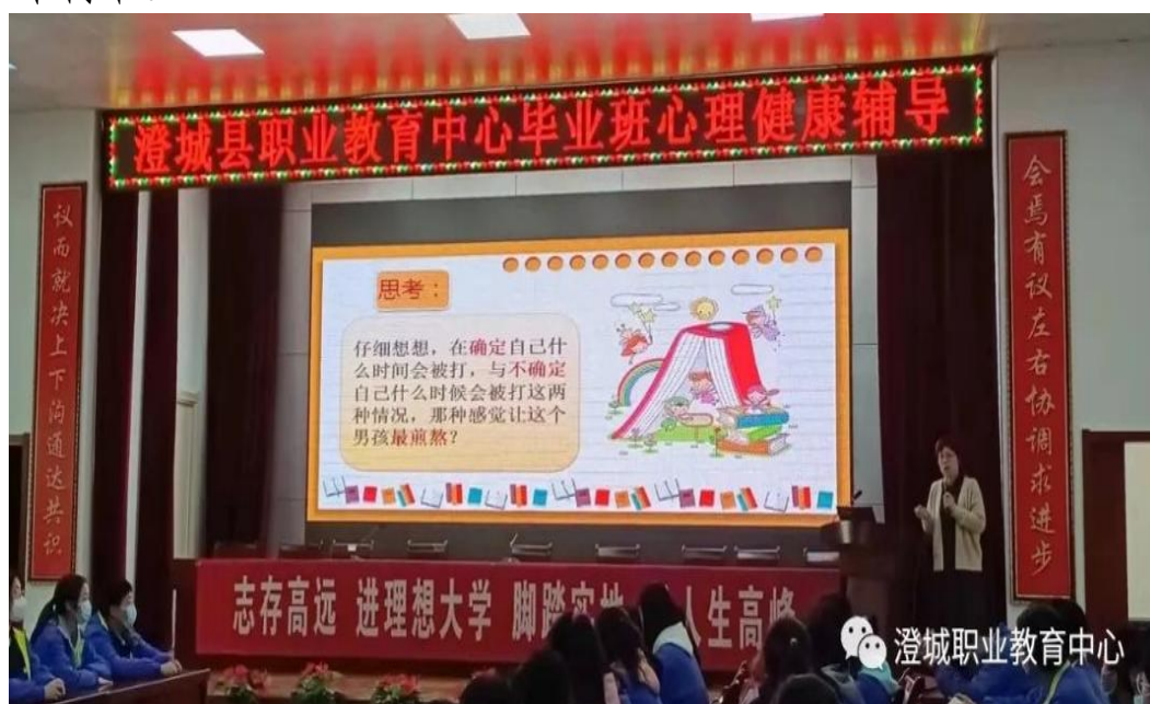
图 2-12 毕业班学生心理健康辅导活动

精彩的心理讲座，既放松了身心，又激发了热情，同时帮助学生树立起多段人生、终生学习的价值理念。同学们纷纷表示，对 2025 年高考充满了信心，将以更加饱满的热情、更加昂扬的斗志投入到高考复习冲刺中。