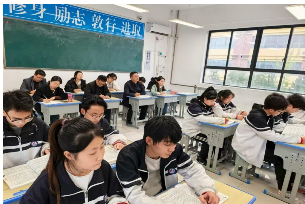
图 1-5 新分教师亮相课