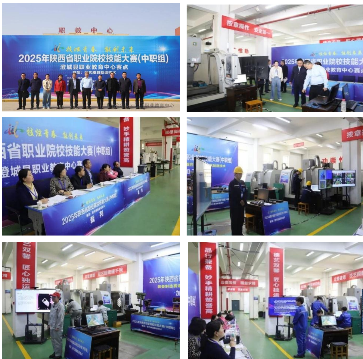
图 2-26 承办 2025 年陕西省职业院校技能大赛现代模具制造技术赛项