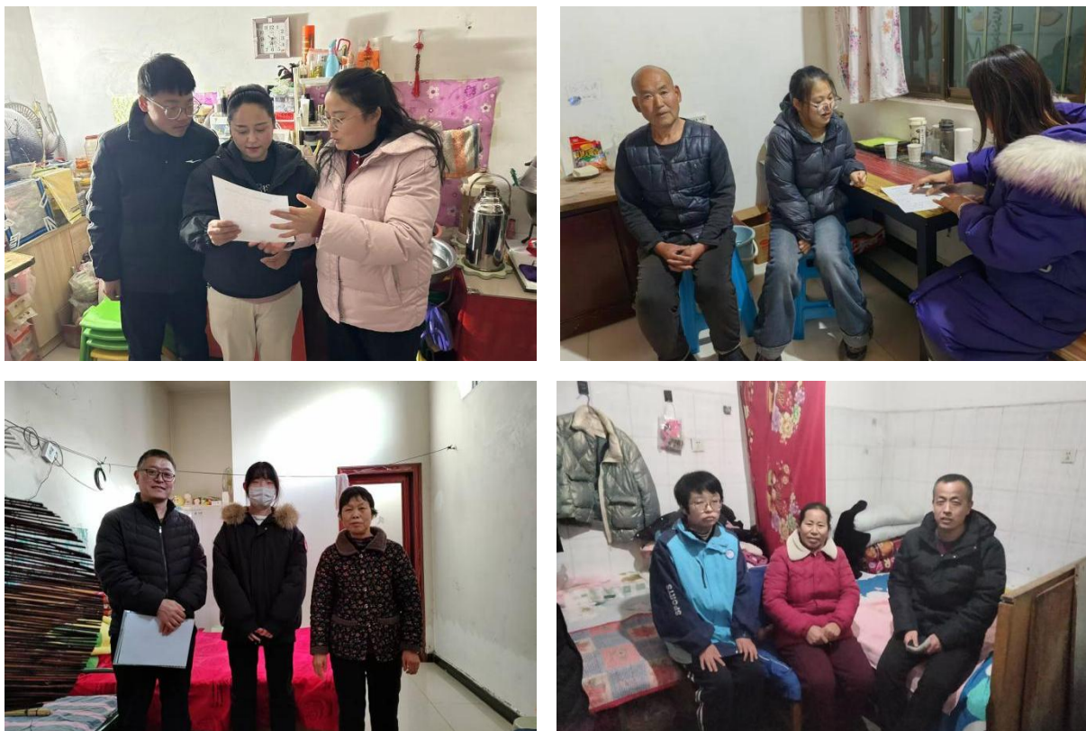
图 2-18 班主任冬防安全大家访活动

本次大家访活动累计走访外宿生 793 人，不仅有效消除了外宿生住宿环境中的安全隐患，增强了学生及家长的安全防范意识和自救互救能力，更搭建了家校沟通的坚实桥梁，凝聚了育人合力。下一步，学校将建立外宿生安全管理长效机制，定期开展安全走访与教育活动，持续筑牢校园安全防线，为学生健康成长保驾护航。