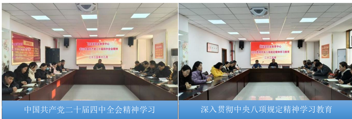
图 2-2 行政会主题学习教育