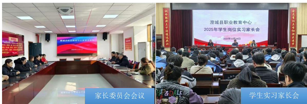
图 2-6 家校协同育人