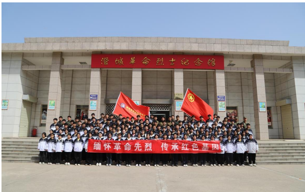
图 4-3 清明节烈士陵园祭扫活动