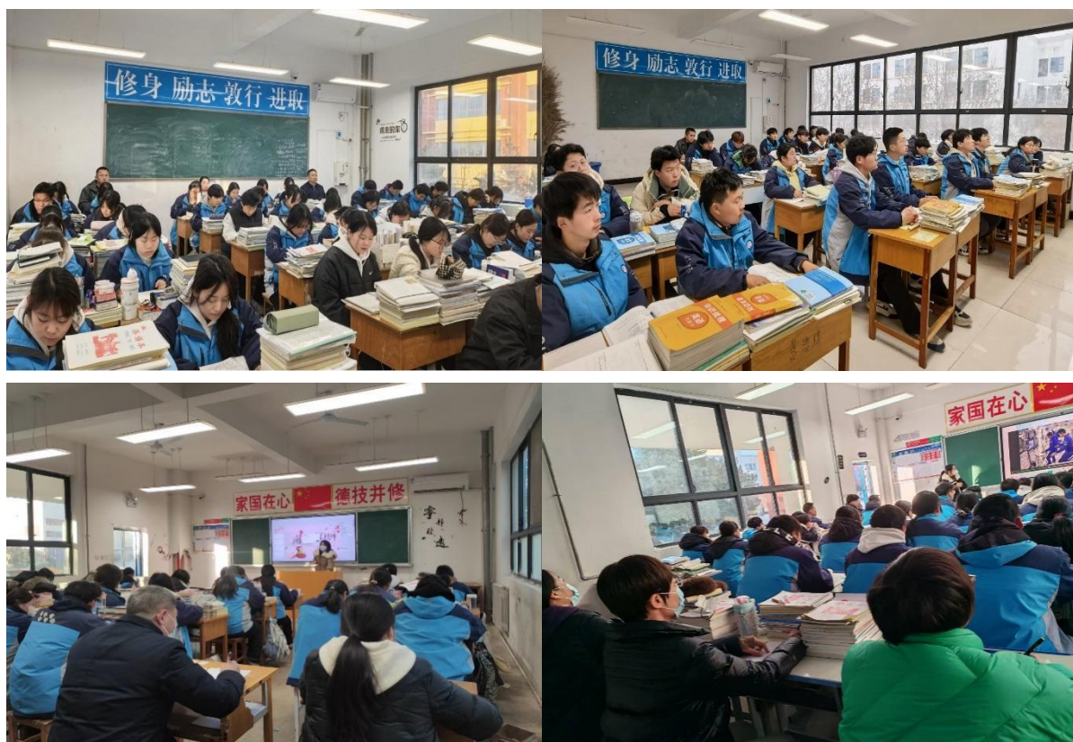
图 1-6 学校领导推门听课

通过三种听课方式的协同推进，教师教学能力显著提升，课堂教学规范化水平明显提高。一年来，教师优质课获奖数量同比增长 30%，学生对课堂教学的满意度达 96%，多元听课评课机制已成为学校提升教学质量、促进教师专业成长的重要抓手。