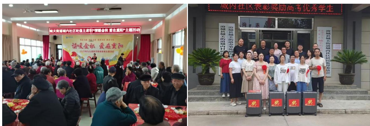
图 2-3 参与社区轮值主席制活动