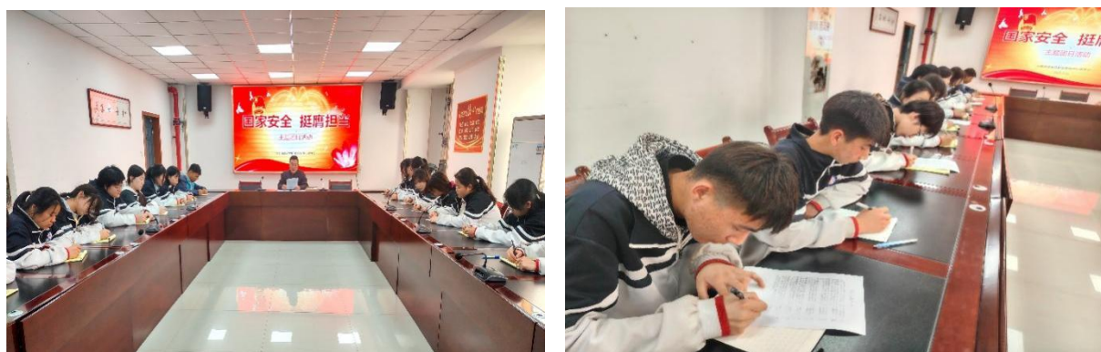
图 2-13 “国家安全 青春挺膺” 国家安全教育主题团日活动

为深入贯彻习总书记关于加强国家安全教育的重要指示批示精神，进一步引导广大团员青年深入学习贯彻总体国家安全观，动员引领广大团员青年坚定不移走中国特色国家安全道路，切实增强忧患意识和使命担当，勇于为维护国家主权、安全、发展利益挺膺担当。按照澄城县团委统一安排，4月11日至17日，学校团委开展了以“国家安全 青春挺膺”为主题的周系列活动。活动前期，通过团支书会议、海报宣传等方式营造氛围。活动期间，各团支部开展了多样活动，包括主题团课、宣誓签名、安全隐患排查、知识竞赛等多种形式。同学们结合专业特色，在各个活动中积极参与，既排查了安全隐患，又提升了国安知识储备。活动最后，学校举办成果展评和表彰大会，对表现优秀的团支部和个人进行表彰。此次活动将国家安全意识融入学生专业学习与日常，对培养学生的担当意识起到积极作用。