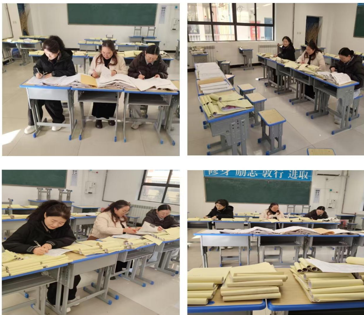
图 7-1 教学常规检查