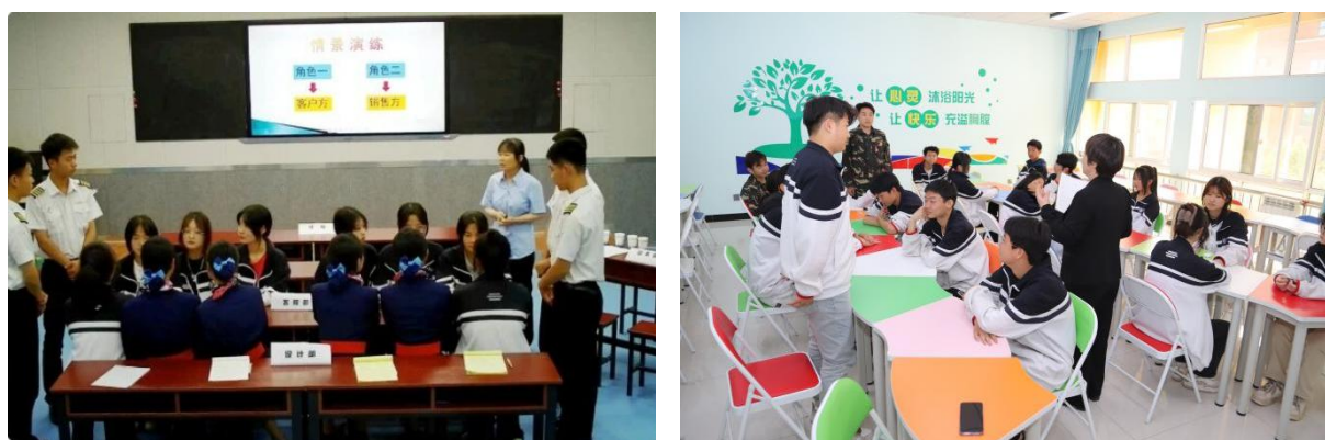
图 2-20 情境模拟教学

以上。充分利用国家智慧教育平台等数字化教材资源库，实现教材形式多样化、资源共享化，满足理实一体化教学与学生自主学习需求。依托希沃白板、钉钉等学习平台实现线上线下混合式教学，满足个性化学习需求。开展教师“人工智能 + 教学”专项培训，提升教师数字化教学能力，推动教学改革向纵深发展。本年度，累计 13 名教师在省市县微课程大赛中获奖，2 名教师在渭南市信息化教学创新案例评选中获奖，2 个市级教育信息化研究规划课题结题，3 篇教育信息化研究论文公开发表，教师的数字化教学素养显著提升。