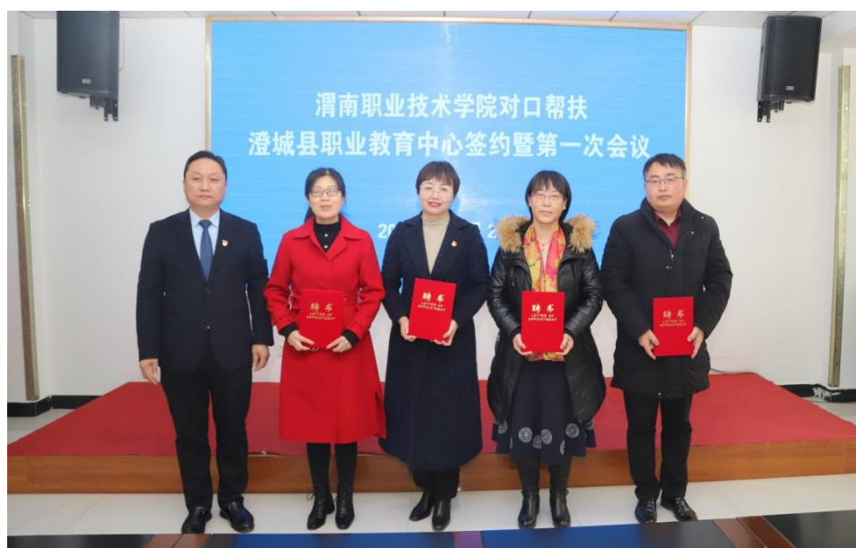
图 2-21 渭职院对口帮扶签约仪式颁发聘书

贯通培养体系的构建，不仅拓展了学生的学历提升空间，更强化了人才培养的针对性与系统性，提升了学生的职业竞争力。学校将继续拓展合作院校资源，优化衔接专业布局，完善人才培养质量评价机制，推动中高职贯通培养向更高质量发展，为学生实现长远职业发展奠定坚实基础。