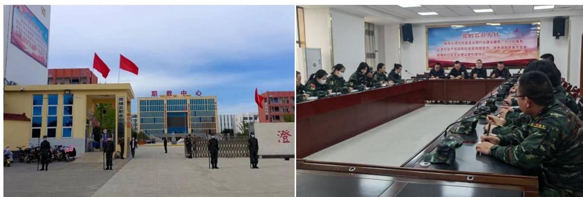
图 2-7 准军事化管理