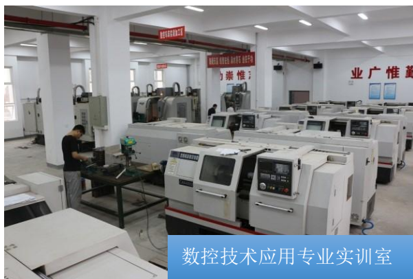
数控技术应用专业实训室

实训设施精准对接，强化技能培养实效。围绕专业建设核心，学校重点打造了与产业需求相匹配的实训基地。现有校内实训室 11 个，校外实训基地 3 个，涵盖数控技术应用、汽车运用与维修、计算机应用、工业机器人技术应用、幼儿保育、航空服务、电子商务、中医养生保健 8 个专业，校内实训实践工位数 1056 个，生均实训设备值 5.8 万元。本年度，学校投入 112.6 万元新建成高标准的新能源汽车实训室，校企合作企业在学校建成航空服务实训基地，同时投入资金重点更新了老化设备及前沿技术设备，确保实训教学与行业技术发展同步。所有实训设施均建立使用台账，实训率达 100%，有效支撑了“理实一体化”教学模式的落地。