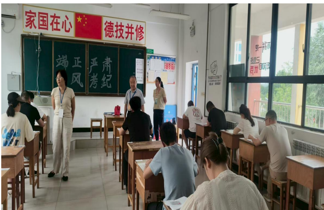
图 3-2 国家开放大学澄城学习中心期末考试