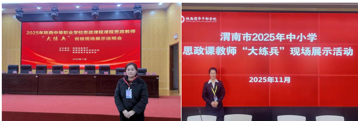
图 2-8 教师参加省市思政课大练兵现场展示活动

学校严格依据《教育部 2020 版中等职业学校思想政治课程标准》，开足开齐思想政治四门必修课程，并在其他公共课程和专业课教学中有效渗透课程思政，夯实学生思想道德基础，守牢思政课程德育主阵地。学校注重学生职业素养培育，将工匠精神、职业认同、团结协作等德育元素融入专业课程教学，对接行业岗位德育要求，增强课程针对性，推动“思政 + 专业”同向同行。为学生统一配发国防教育、习近平新时代中国特色社会主义思想、社会主义核心价值观、禁毒教育、安全教育等系列读本，开展班级责任区劳动等社会实践活动，关注学生心理健康，利用改造升级的心理咨询室每周定期进行团体辅导和个体辅导，开展全员心理健康筛查，对筛查出的 42 名存在问题学生建立专项台账并动态跟踪，对 14 名重点学生建立《一生一策心理健康档案》，由行政领导、班主任“一对一”帮扶关爱，多维度提升学生思想政治素养。2025 年度，1 名教师在陕西省思政课大练兵展示交流活动中荣获特等奖，3 名教师在渭南市思政课大练兵活动中获奖。