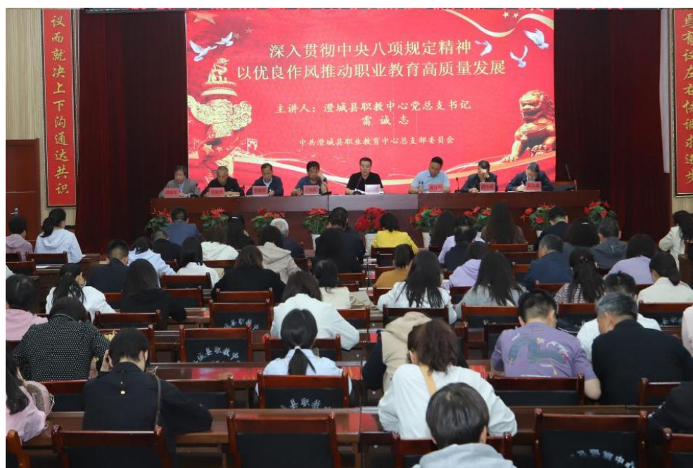
图 2-1 党总支书记讲党课

学校党总支始终把“学思想”作为政治必修课，组织党员、教师深入学习党的创新理论，提升全员思想理论水平。严格落实“三会一课”、“主题党日活动”。本学年，累计开展党总支书记讲党课两次，周例会深入贯彻中央八项规定精神学习教育 12 次、抗战胜利 80 周年系列讲话学习 5 次，二十届四中全会精神学习 5 次，深入学习上级各项决策部署，进一步强化全体领导的理论武装。将思想政治教育融入教育教学全过程，构建“思政课程、课程思政、文化思政、实践思政”四线联动思政育人体系，鼓励教师积极参加省市思政课大练兵活动，深入包联社区、养老院开展知识宣讲、卫生清扫等志愿服务。通过丰富党员教育活动生活，调动了党员的积极性，增强了党员的宗旨意识，提升了党建工作整体水平。