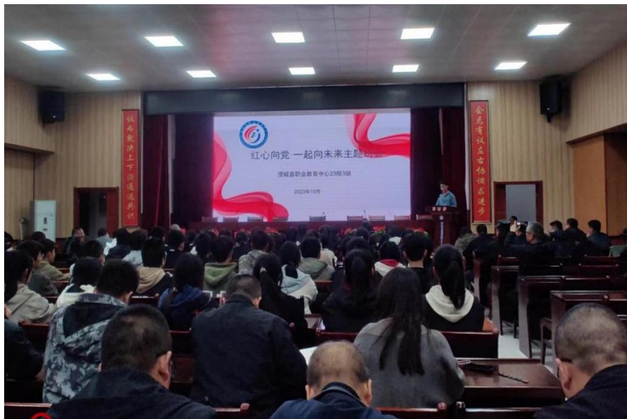
图 2-10 “一起向未来”主题班会