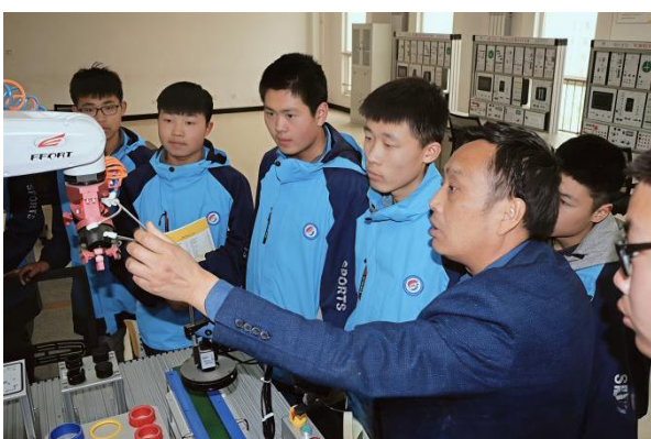
图 2-19 各专业实训教学