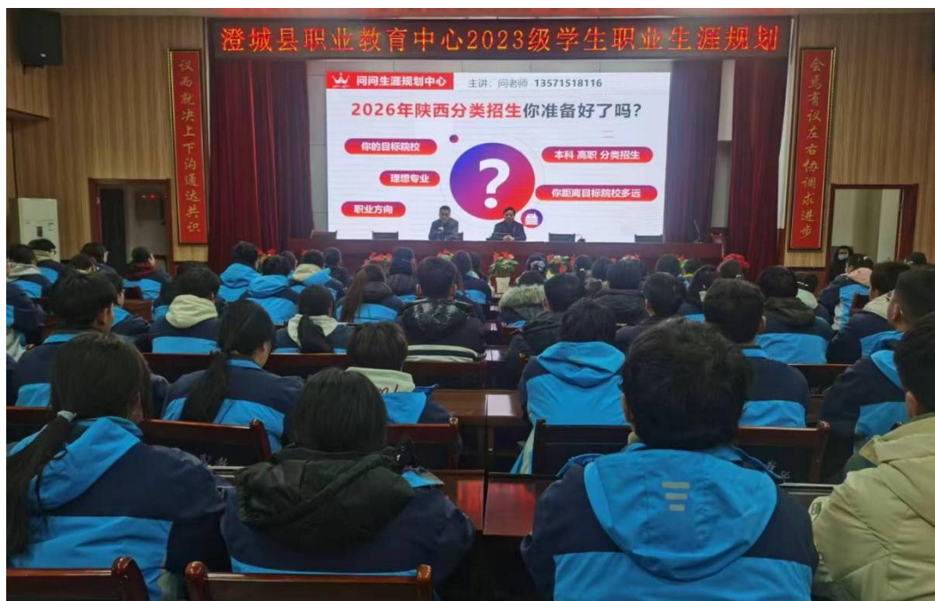
图 2-24 学生职业生涯规划宣讲会