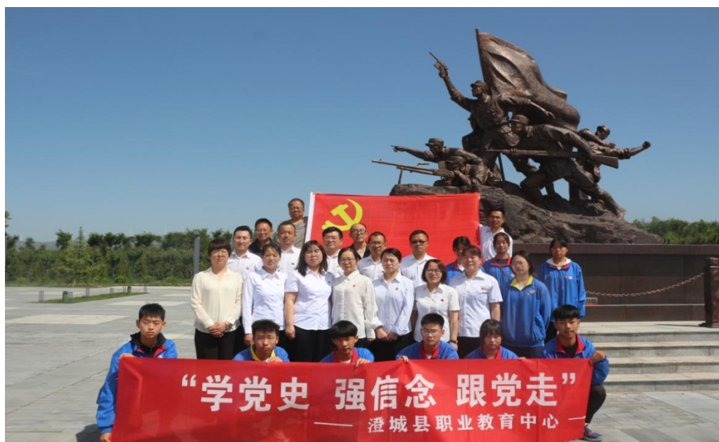
图 4-2 深入壶梯山进行爱国主义教育

一系列教育举措，有效引导学生从红色基因中汲取奋进力量，学生的爱国情怀、责任担当显著提升。学生主动参与志愿服务、公益活动，红色基因已转化为其成长成才的精神动力，为培养担当民族复兴大任的时代新人提供了强大支撑。