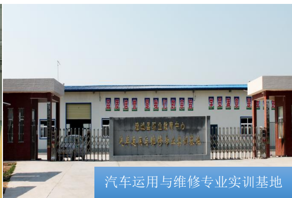
汽车运用与维修专业实训基地