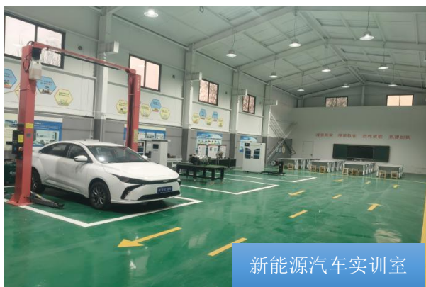
新能源汽车实训室