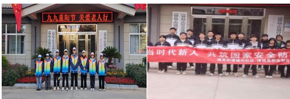
图 2-4 志愿服务活动