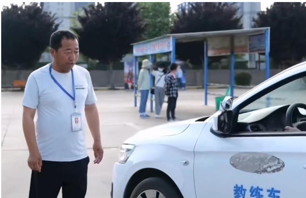
图 3-1 汽车驾驶员培训