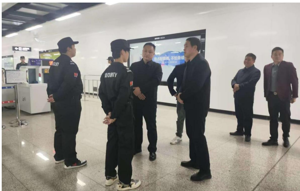
图 5-2 校领导赴企业进行学生实习情况回访

学生一年级在校学习公共基础课和专业基础课程，二年级在校学习专业核心课程为主，期间赴企业进行为期三个月的跟岗实习；学生平时在校单项性实习以实训室为主，综合性实践以校办企业为主，这种实习制度让学生学习了知识，强化了技能，了解了社会；让学生在动脑中启迪智慧、在动手中提升技能，树立起了“劳动光荣、技能宝贵、创造伟大”价值追求。