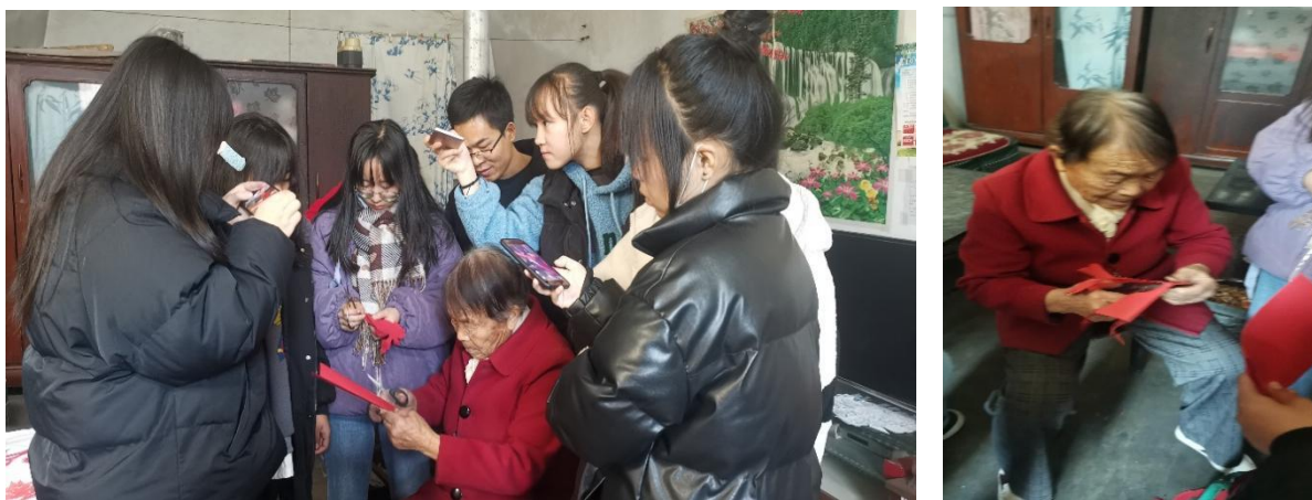
图 4-7 民间艺人传授剪纸技艺

社团积极搭建“校园+社会”双向实践平台，让文化传承落地生根。在校内打造剪纸文化长廊，定期举办主题展览，形成沉浸式文化氛围；走出校园开展公益传承活动，走进县域中小学开展剪纸体验活动。同时，社团以赛促学，组织学生参与各级专业技能大赛，取得优异成绩。