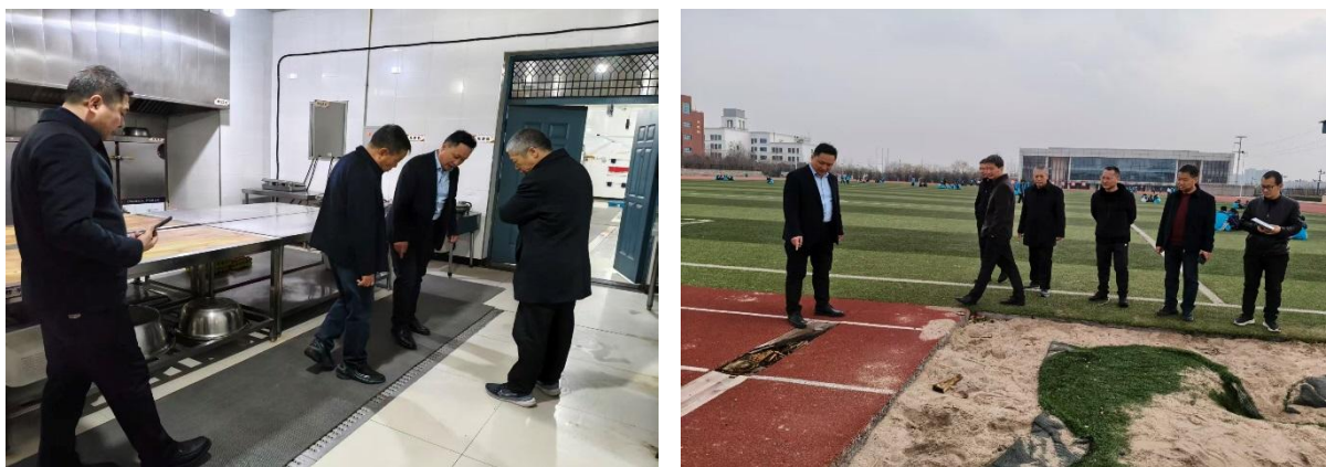
图 2-17 全覆盖式校园安全隐患大排查