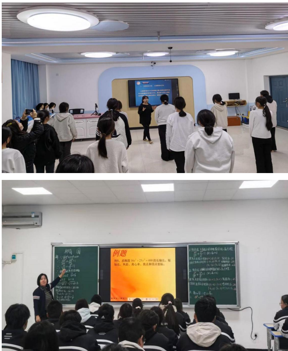
图 1-4 教研组长示范课

领导推门听课筑牢“监督线”。学校领导班子成员随机深入课堂，重点检查教学目标落实、教学规范执行、学生参与度等情况，既关注公共基础课的知识传授质量，也重视专业技能课的实操指导效果。听课结束后，领导与授课教师即时沟通，肯定亮点的同时，直指教学过程中存在的流程不清晰、重难点不突出等问题，推动教师严格落实教学规范，确保课堂教学不走过场。