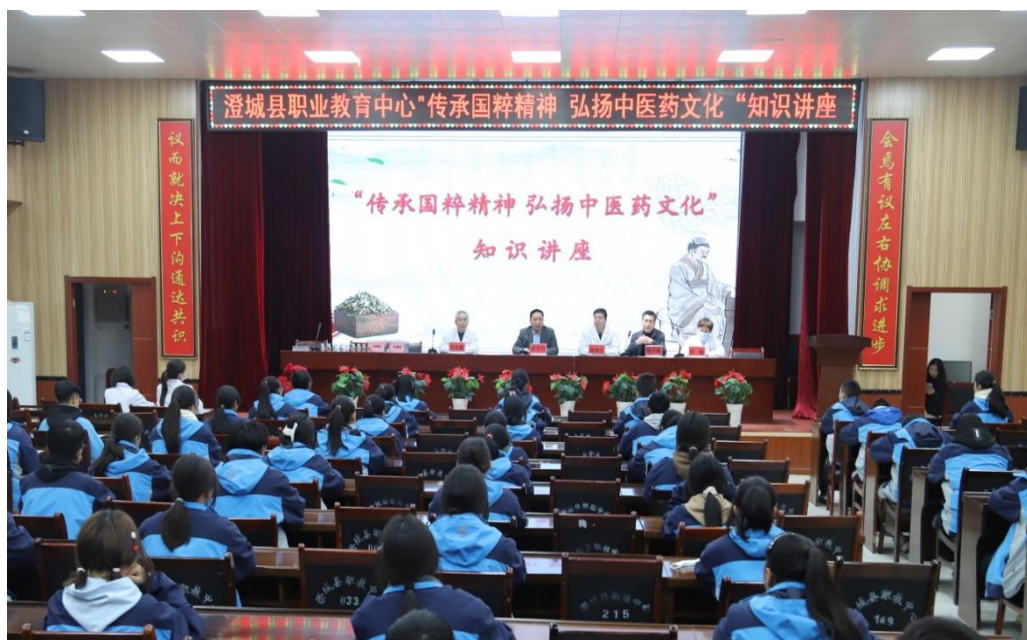
图 4-5 “传承国粹精神 弘扬中医药文化”知识讲座