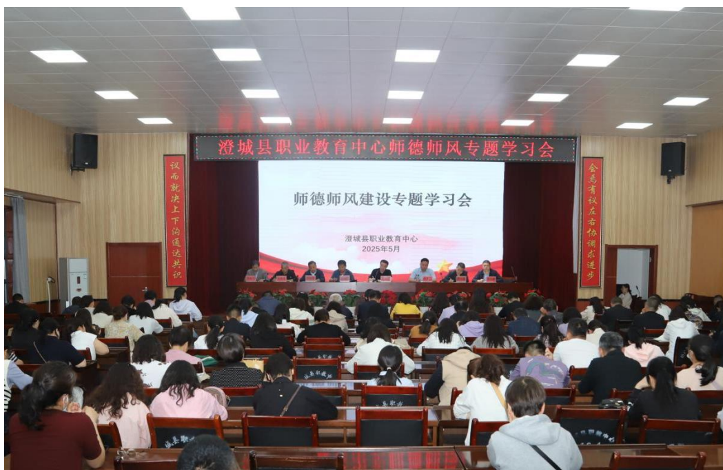
图 1-1 师德师风建设专题学习会

二是强化专业培养培训。为促进教师专业成长，学校坚持“走出去，请进来”的管理思路，建立教师全员培训制度，规定具体培养方法、实施要求和考核评定标准，努力为教师培训和学习搭建平台，本年度累计组织教师参加国省市举办的骨干教师培训 54 人次、教师进企业实践和东西部职业教育协作计划 13 人次、学校党组织书记与德育思政骨干教师培训 5 人次、国家智慧教育平台寒暑假全员培训、澄城县教体局组织的暑期全员培训和学校组织的各类业务培训。加强对教师进行微课、信息技术等技能和方法的专项培训和辅导，推动教师进行信息化教学改革，将信息化技术运用到教学过程中。通过学习、交流、研修等形式，提高了教师的专业素养和综合素质。