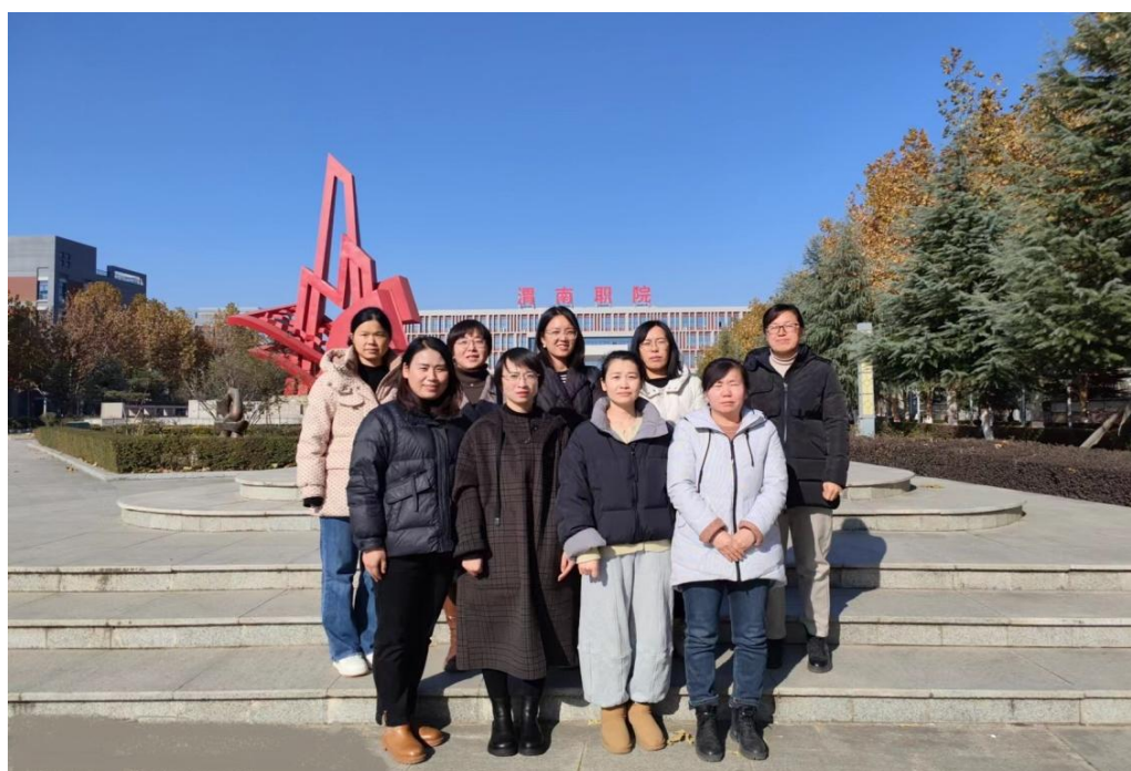
图 2-23 教师赴渭南职业技术学院交流学习