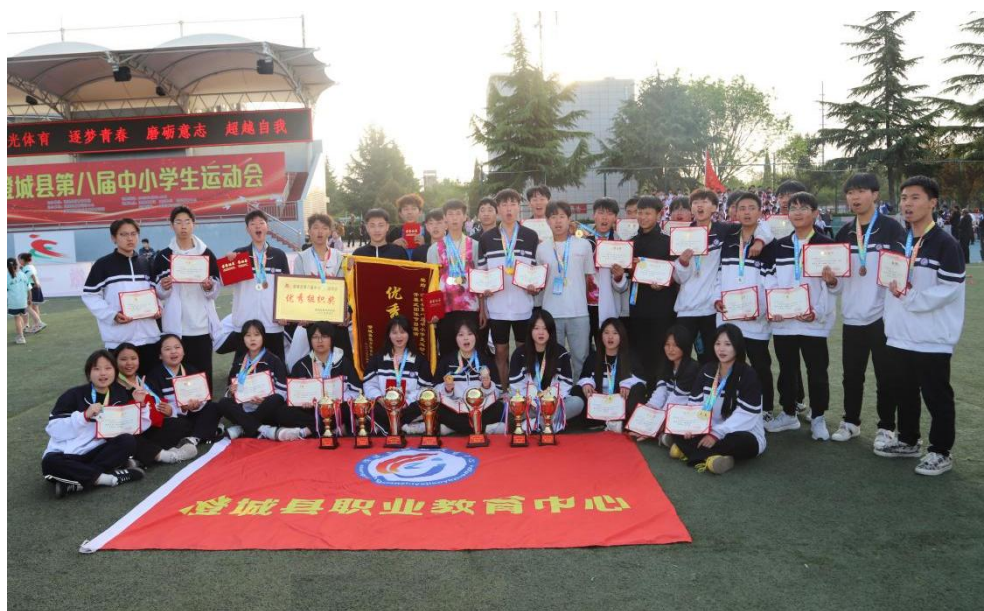
图 2-11 学生参加县中小学生运动会取得多项殊荣