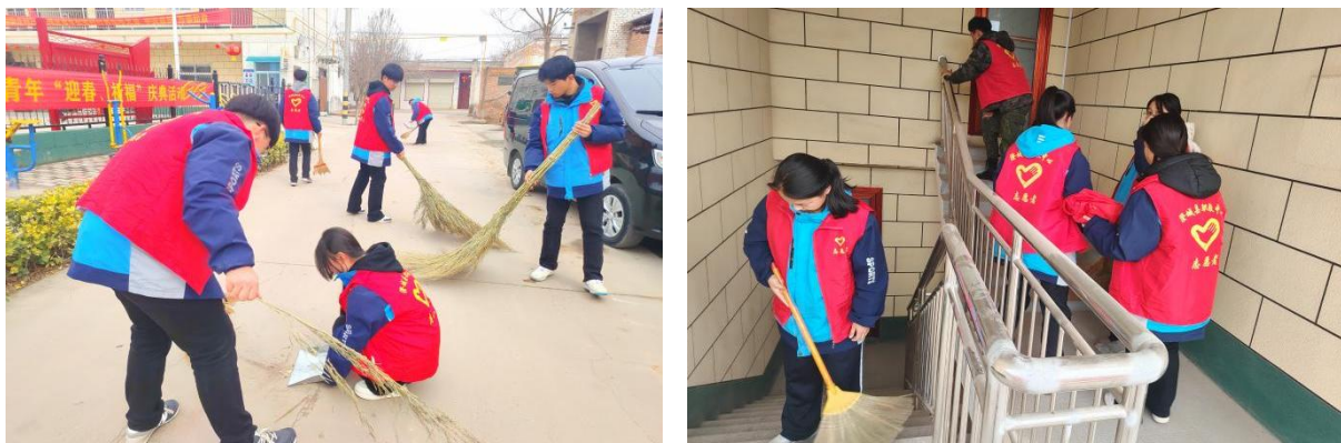
图 3-3 学雷锋志愿服务活动