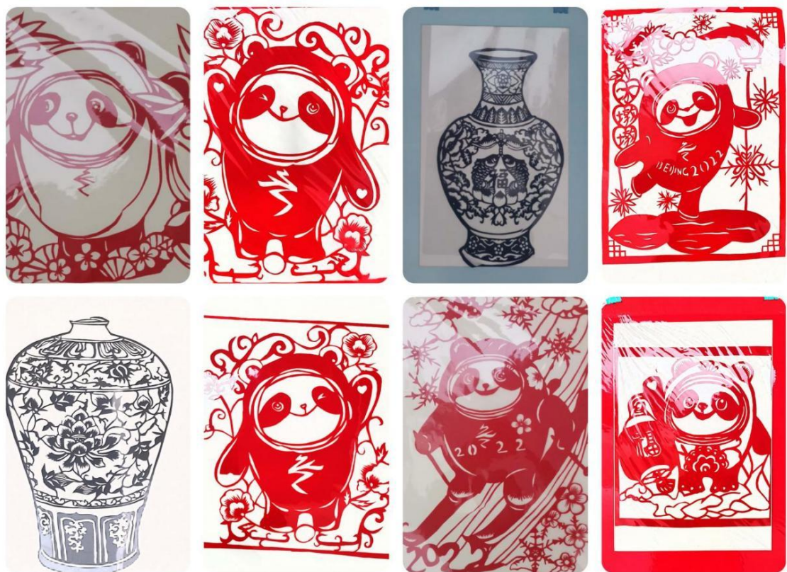
图 4-6 学生传统文化技艺手工作品