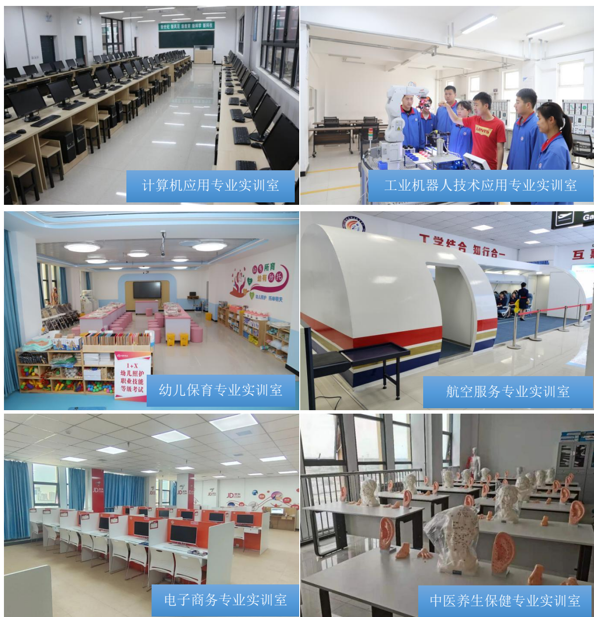
图 1-7 学校实训室

生活设施优化升级，提升校园宜居品质。学校高度重视学生生活保障，持续改善住宿、餐饮等生活设施条件。现有学生公寓 1 栋，床位 1200 张，生均住宿面积 6.8 平方米，公寓内配备独立卫生间、衣物柜等基本生活设施，实行 24 小时值班管理制度，保障学生住宿安全与舒适。学校食堂建筑面积 4795 平方米，可同时容纳 3000 名学生就餐。此外，学校建有标准化运动场、篮球场、乒乓球桌等体育设施，为学生开展体育锻炼、增强体质提供充足空间；校园内道路平整、绿