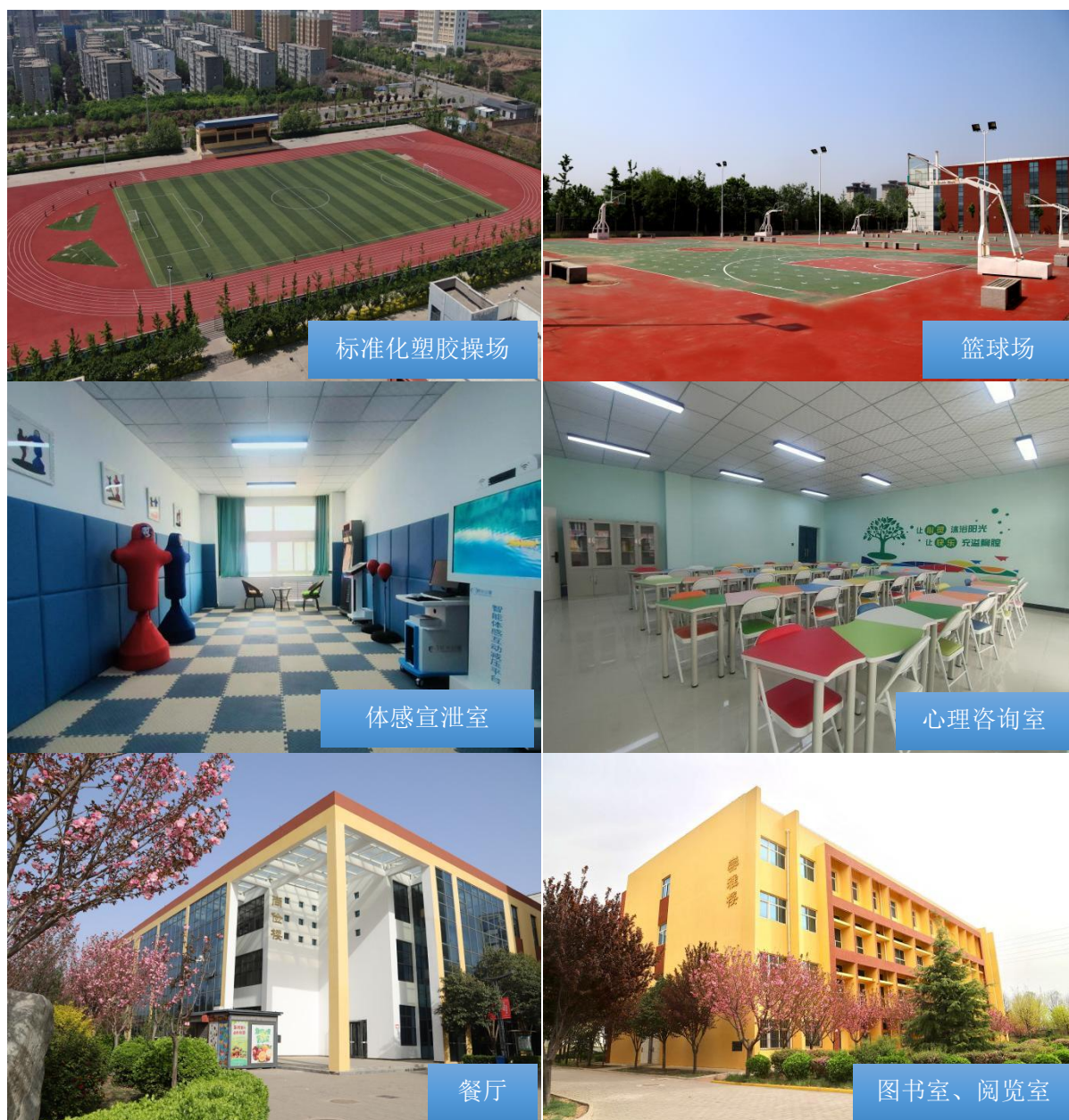
图 1-8 学校硬件设施

化达标，配备完善的给排水、供电、消防等基础设施，构建了安全、整洁、宜居的校园环境。