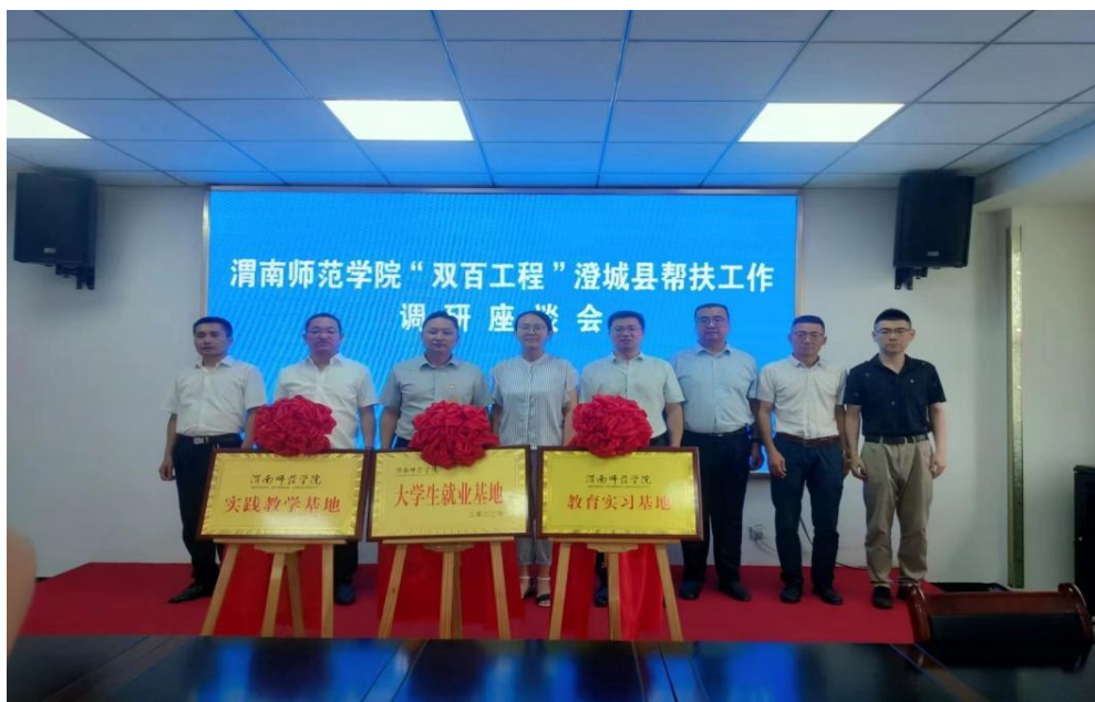
图 2-22 渭南师范学院“双百工程”授牌仪式