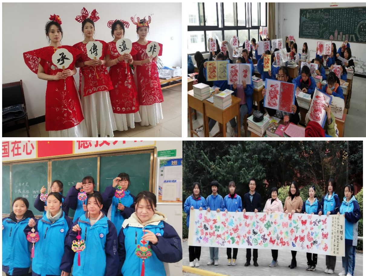
图 4-8 学生部分优秀作品

社团将继续深化“产教融合”路径，与文创企业合作开发更多实用型产品，让剪纸艺术在传承中创新、在创新中发展，为传统文化的活态传承注入青春力量。