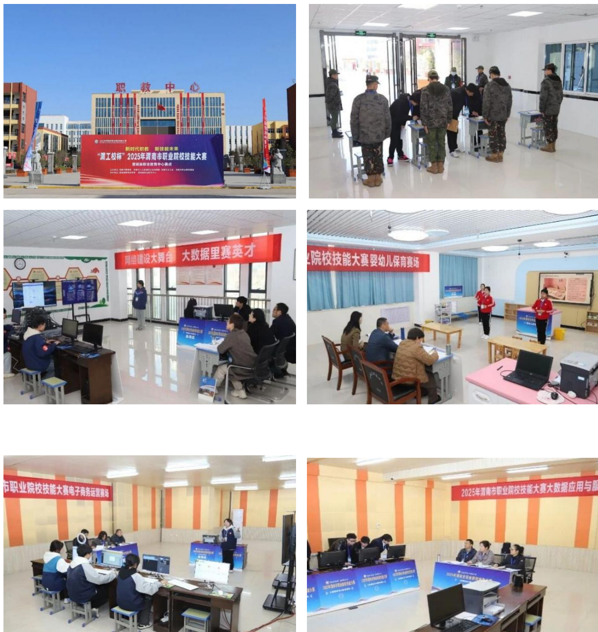
图 2-25 承办 2025 年渭南市职业院校技能大赛四个赛项