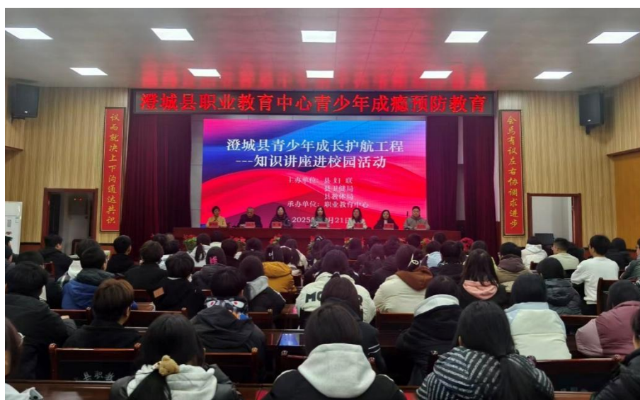
图 2-9 澄城县青少年成长护航知识讲座进校园活动

学校以活动为载体，开展各种形式的德育主题教育活动，全面提高学生综合素养。开展阳光体育大课间活动，足球、羽毛球等球类社团定期开展活动，圆满承办团县委“青春为中国式现代化挺膺担当”主题宣讲暨新团员集中入团仪式、澄城县第八届中小学生运动会足球、排球项目的比赛。开展“红心向党·一起向未来”主题班会、每周人文课堂经典视频欣赏、国旗下演讲、社区志愿服务等活动，定期举办法制报告会、预防电信诈骗讲座、学生职业生涯规划宣讲、大国工匠进校园等丰富多元的育人活动，培养更多让党放心、爱国奉献、担当民族复兴重任的时代新人。2025 年度，学生先后荣获渭南市优秀学生社团一等奖，县阳光体育大课间展演第三名，县中小学生艺术展演优秀作品 8 个，县中小学生运动会 21 个奖项，5 名学生在陕西省中小学生同题作文比赛中获奖，4 名优秀学子获得国家职业教育奖学金每人 6000 元。