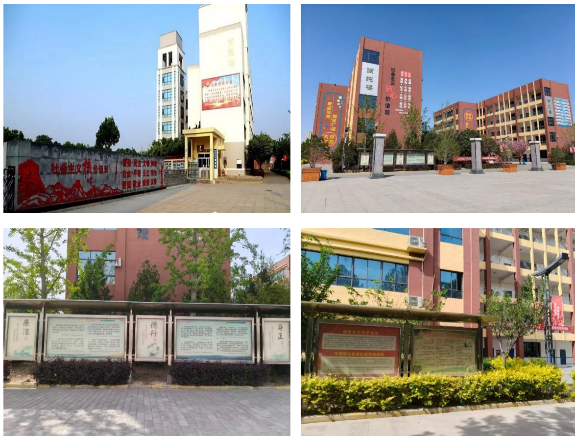
图 2-16 校园文化

立体式的具有职教特色的校园文化体系。校园里随处可见的校园楹联、《职教赋》充分体现了学校的办学理念，彰显了职教团队的治校水平，橱窗的《感动中国人物》、《大国工匠》等内容和名人苑、文化柱内的澄城名人历史事迹以及名人名言鞭策激励着全体师生奋发向上、励志敦行，逐步形成了以社会主义核心价值观为核心，以《职教中心赋》、先进人物事迹、校园楹联、澄城名人、校训等为主要内容的校园文化体系。