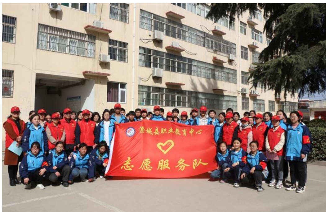
图 3-4 包联小区关爱老人志愿服务活动