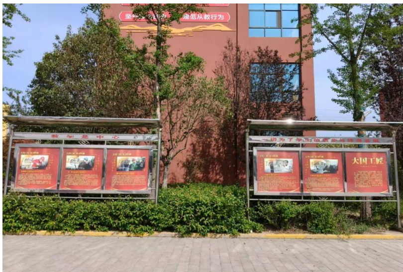
图 4-1 校园橱窗大国工匠人物事迹宣传