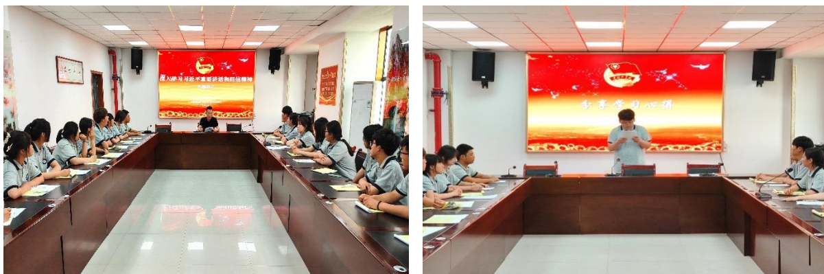
图 2-15 《深入学习习近平重要讲话和回信精神》主题团日活动

为深入学习习近平总书记重要讲话和给谢依特小学戍边支教西部计划志愿者服务队队员回信精神，5月26日，共青团澄城县职业教育中心委员会精心组织开展《深入学习习近平重要讲话和回信精神》主题团日活动，引导广大团员青年深刻领悟精神内涵，坚定理想信念，担当时代责任，在校园内掀起学习热潮。团支书带领团员青年认真研读习近平总书记重要讲话原文及回信内容，逐字逐句分析，深入领会精神实质。学习过程中，团员们全神贯注，不少同学认真做笔记，记录重要内容与自身感悟。本次主题团日活动通过创新学习形式、引导青年坚定信念，达到预期学习效果。校团委将总结经验，改进不足，继续加强团员青年思想政治教育，创新学习形式与活动载体，持续深入学习习近平新时代中国特色社会主义思想，引导广大团员青年牢记总书记殷切期望，在实现中华民族伟大复兴征程中贡献青春力量。