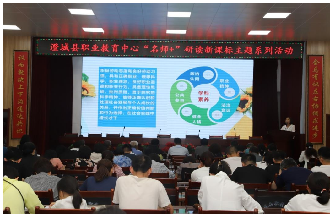
图 1-3 “名师+”研读新课标主题系列活动

一年来，累计有4名教师在省市中职学校思政课大练兵活动中获奖，13名教师在省市县微课程大赛中获奖，4名教师在县教学研究室组织的期中教学质量检测质量分析活动中获奖，5名教师在县公开课展示活动中获奖。7个省市县教育研究课题顺利结题，6篇教育科研论文公开发表，学校被县局评为年度教学质量工作先进集体。