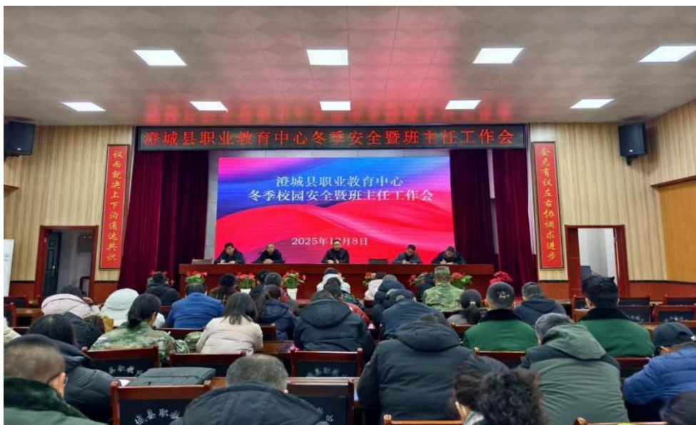
图 2-5 冬季安全暨班主任工作会议