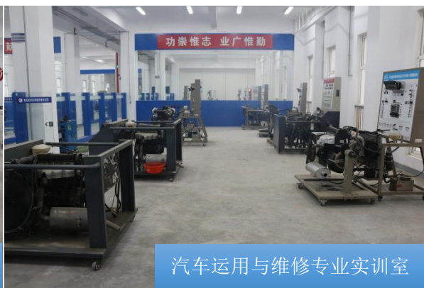
汽车运用与维修专业实训室